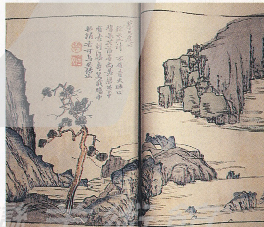
1-9 芥子園畫譜 山水譜