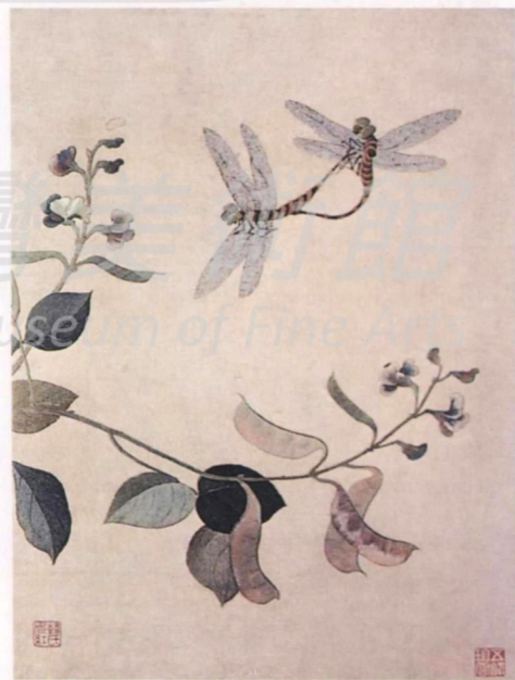
1-4 明上海露香園顧繡