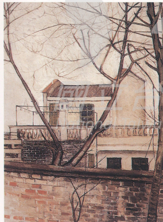
1-7 龐薰琴冬 1931年 油彩、畫布 47×33公分

開拓了席德進的生活與視野，但是所學的卻是應用美術，與他所要追求純粹藝術的理想，不相符合，加上那位留學法國，教他素描又介紹他認識馬諦斯、畢卡索的龐薰琴老師，離開了學校到因抗戰搬遷到重慶的國立藝專去任教，學校的課程就再也不能滿足席德進熱切的需求了。他與其他幾位同學辦理了退學，準備追隨老師而去。