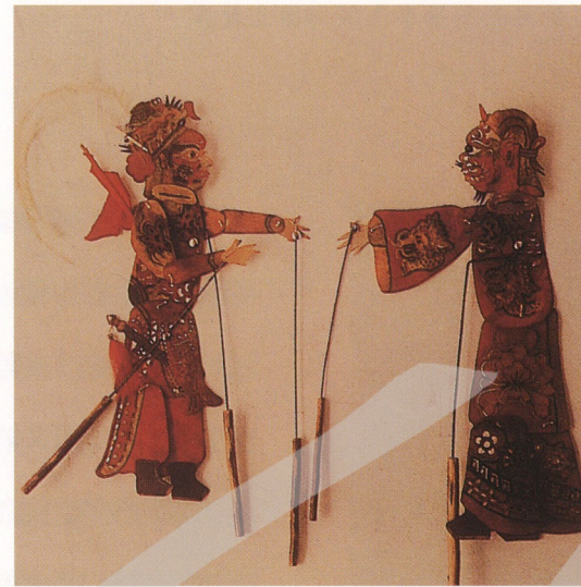
1-6 大陸磁縣皮影戲偶

皮影戲，是以燈光照射獸皮或紙板作成人物剪影為傀儡的一種民間影子戲。一般的皮影影人高約一尺左右，身上有許多關節，依動作需要，操縱者按鋼質細桿操縱，影偶就能表演出各種動作。