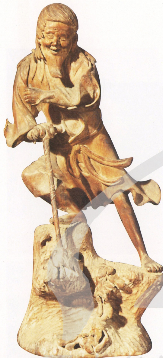
2-11 黃土水 李鐵拐 1915年 木雕 高30公分 這是黃土水入東京美校時繳交的實技檢定作品。因為黃土水是由殖民地長官保薦入學的，所以不須考試，僅須以實際作品來審查。