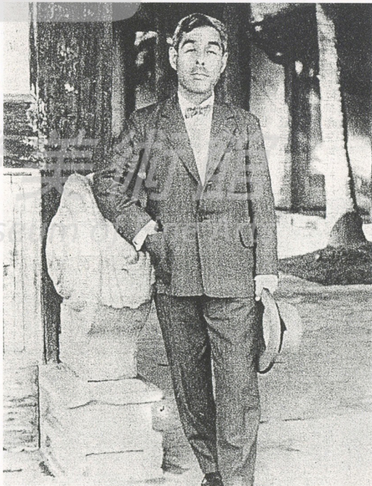
2-13 石川欽一郎 (1872~1945) 石川欽一郎曾兩度來台任教，向台灣青年介紹水彩畫，鼓勵學子赴日留學，推動畫會成立，可以說是台灣早期美術運動的啟蒙者。