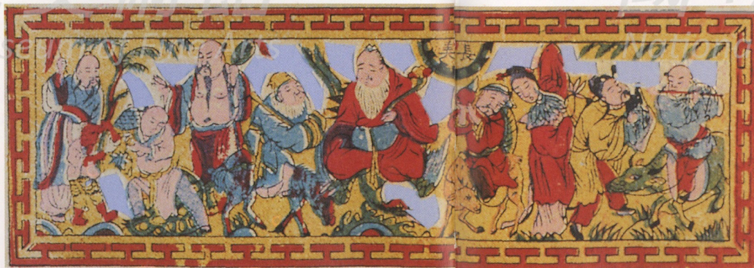
2-10 台灣傳統版畫中的八仙圖 (楊永智先生 收藏)

俗稱「八仙采」，是民間故事的畫題。相傳有七男一女修得一身本領，普渡大海，各顯神通。每人各有一個法寶：鍾離權的扇子、張果老的魚鼓、韓湘子的花籃、李鐵拐的葫蘆、呂洞賓的寶劍、曹國舅的玉板、藍采和的洞簫、何仙姑的荷花。