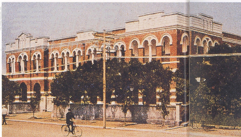
2-2 總督府國語學校 (立虹出版社 提供)

圖為一九一〇年代初的艋舺公學校校門。由此可見日人以國語學校為在台教育最高位階的教育政策，其他的初等教育均是其附屬機構。 (立虹出版社 提供)