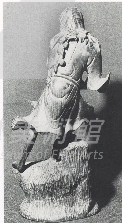
2-12 李鐵拐 (背面)