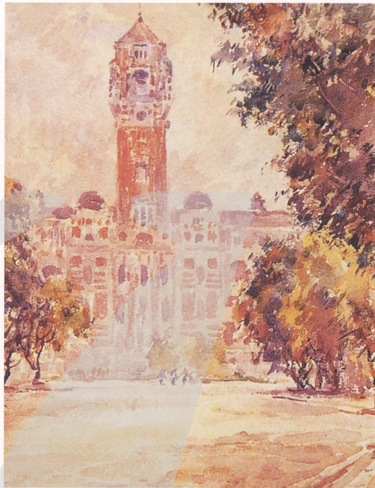
2-14 石川欽一郎 台北總督府 水彩 約1916年 石川欽一郎的作品充滿明快的韻律感，色彩亮麗，筆法成熟，擅長渲染與縫合法，田園山水是他主要的描繪對象。

●黃土水就讀國語學校的時候，有一位擅長水彩畫的美術老師石川欽一郎（1872~1945），對台灣西洋美術的發展有很大的貢獻。黃土水就學時，正巧是石川第一次來台（1907~1916任職國語學校），此期間，有三位後來成為藝術家的倪蔣懷、黃土水、陳澄波是前後期同學，結果率先畢業的倪蔣懷，跑出台灣水彩畫的第一棒；比黃土水晚畢業的陳澄波，成為第一位以油畫入選日本帝展的台灣青年畫家。他們都得過石川老師的薰陶與啟發，只有黃土水的興趣在雕刻，不是彩筆，所以沒有引起石川老師的注意。但是美術課之外還有一門手工科，那是黃土水最能發揮天賦的項目，他會雕自己的手，或動物頭像等，獲得手工老師梅村鼓勵有加。沒想到黃土水憑此藝而改變了他的一生。