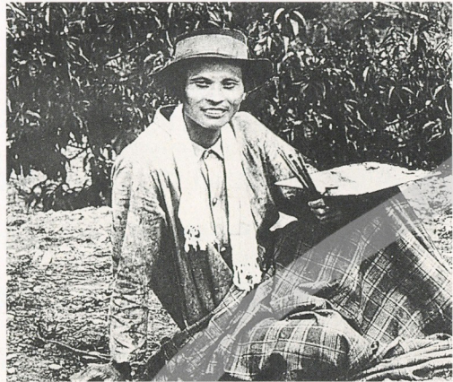
2-17 陳澄波 (1895-1947) 與黃土水同生於一八九五年的陳澄波， 亦畢業於東京美術學校， 一九二六年以「嘉義街外」 成為第一個以油畫入選帝展的台灣畫家。 曾赴上海任教數年， 後來罹難於二二八事件中。