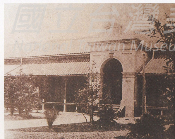
2-3 早期的總督府國語學校校內一景