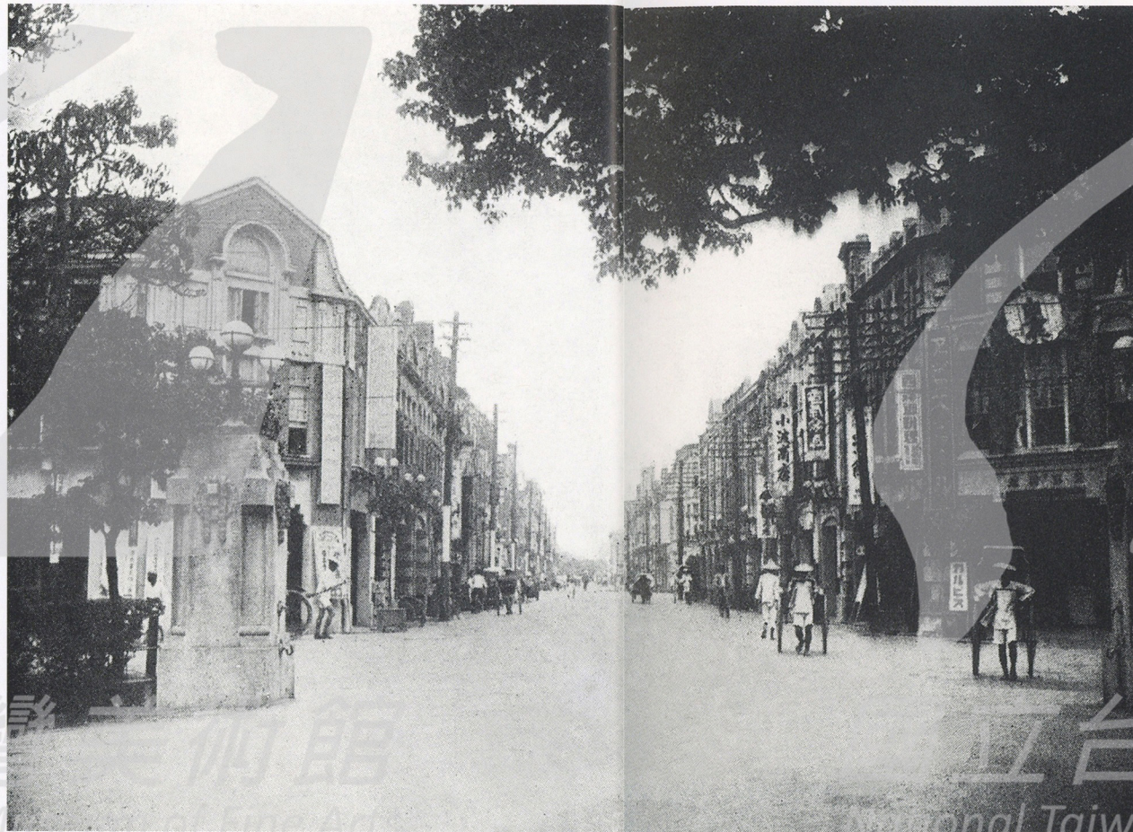
2-7 榮町 榮町是城內日本人的商店街。 圖為今之衡陽路正對新公園側門街景。 街頭有人力車行走。

●國語學校學生一律住校，在課程上已有美術和手工兩科，每週各一小時。黃土水是典型的用功學生，藝能科目的成績當以手工作業最為突出。大家可以想像的，許多學生一旦要交工藝作品時，都拿現成的竹編籃子或簡單的木材手工充數，可是黃土水不一樣，他會繳出親手雕刻的東西。