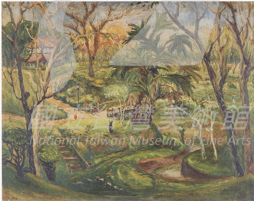
2-18 陳澄波 嘉義公園 1939年 油畫 91×116.5公分