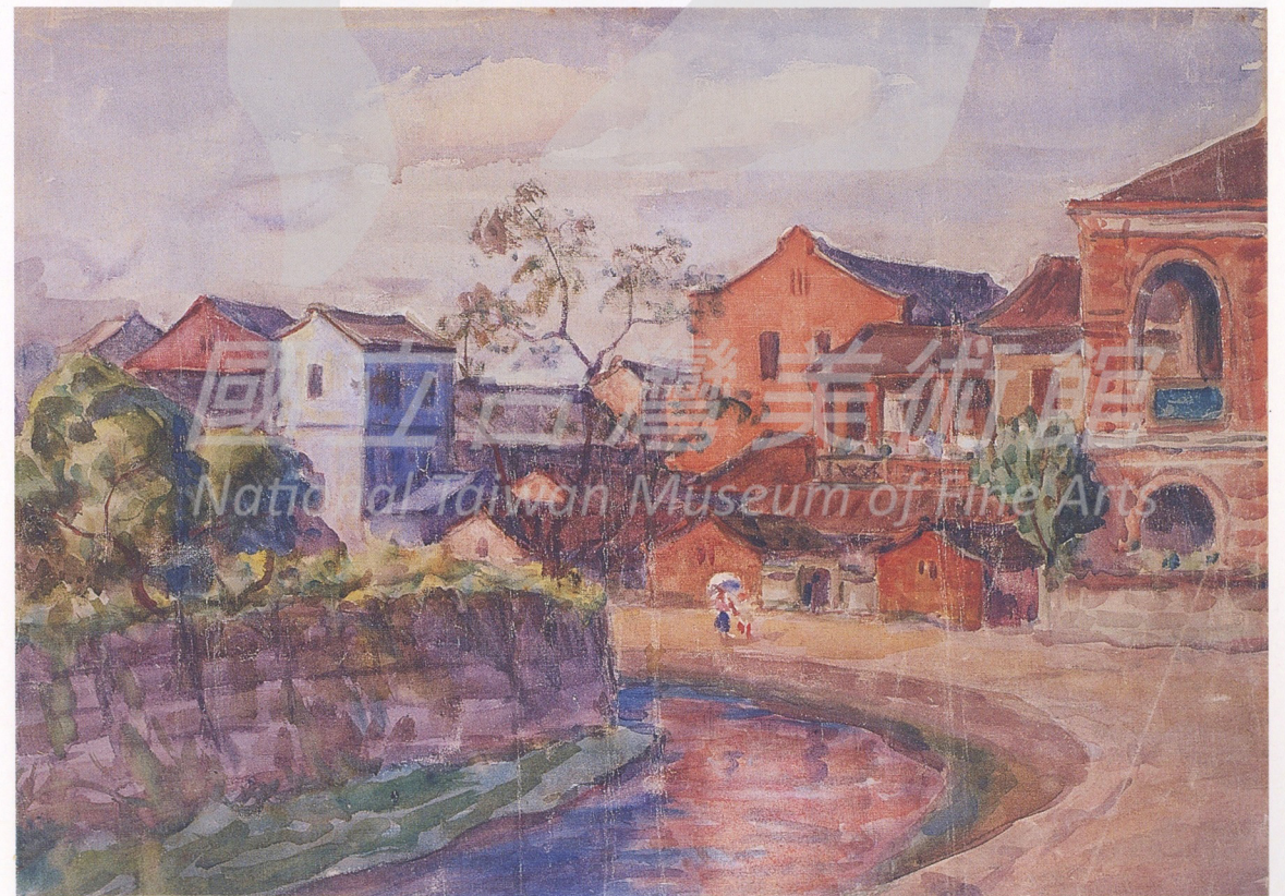
2-16 倪蔣懷 第二水門 水彩 44×60公分 1929年