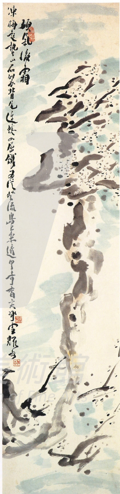
沈耀初 碩氣凌霜 34×139公分