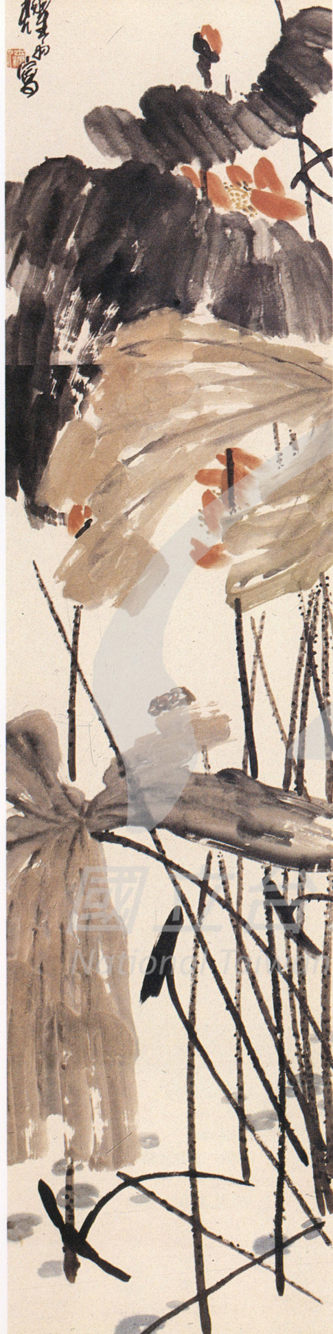
1 沈耀初 荷花 葉榮嘉先生 收藏