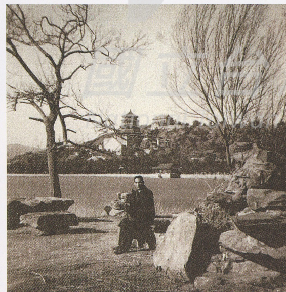
1936年黃君璧攝於北平頤和園