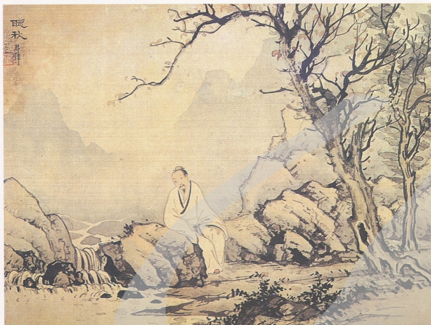
黃君璧 聽秋 1929 水墨設色 33×44公分