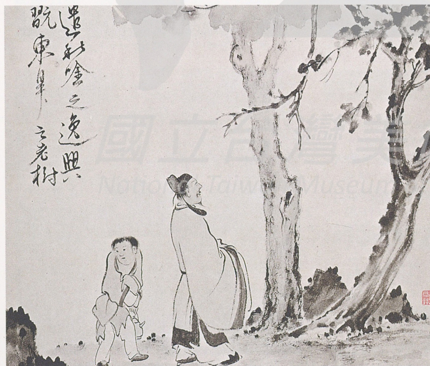
黃君璧 仿新羅吟秋圖 1934 水墨 32×37公分

這件小品絹畫，完成於黃君璧三十一歲那年。此際，他已經擔任廣州美術專科學校的教務主任，也舉行過個人畫展，所以比起早期的「綠水青山長對吟」跟「停琴聽阮」，在技法上顯得成熟了許多。但若從畫面看來，則又和明朝著名的畫家藍瑛(一五八五~約一六六四)十分相近；畫中人物，也是作古代文士的裝扮。可見黃君璧在這段期間，繪畫的風格仍然以摹古為主，因此每一落筆，我們總可以追溯出他所要研習的對象。