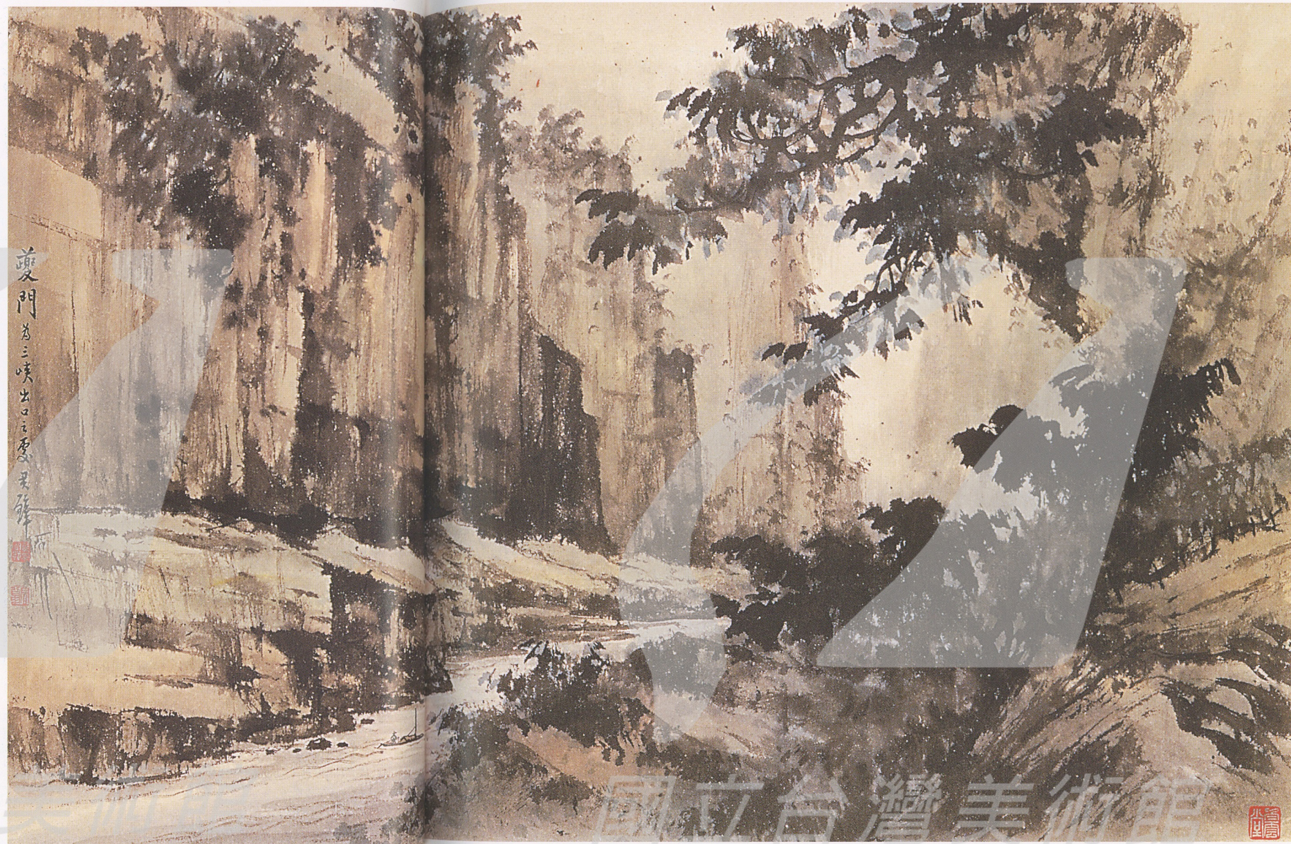
黃君璧 夔門 1965 水墨設色 56×91公分 題款：夔門為三峽出口之處

●日後，黃君璧回憶起這段水路行程，總不忘讚歎長江三峽給他帶來的啟發。他指出：「古畫當中，包含了各式各樣的筆法，比如牛毛皴、披麻皴、斧劈皴、解索皴等等；其實古人並不是憑空杜撰的，這些筆法在三峽的自然風景裡，全部都找得到啊！」至此，他完全領悟「讀萬卷書，行萬里路」的道理，而以一個藝術家的敏銳觸鬚，盡情地吸收大自然的美景，並從中體會出求新求變的契機。