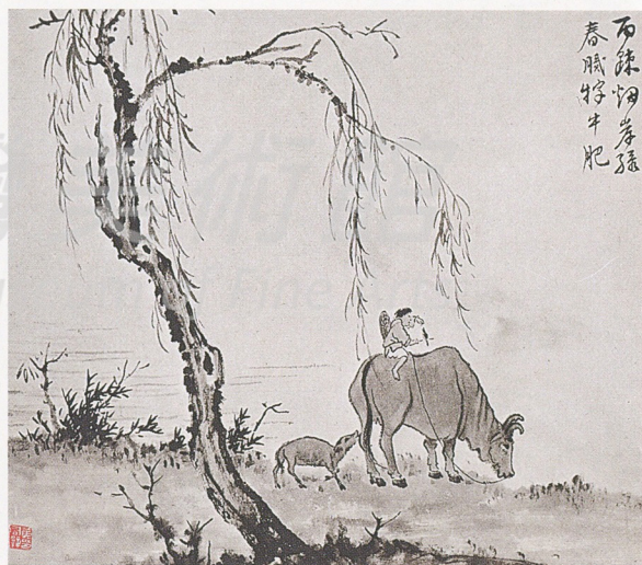
黃君璧 牧牛圖 1934 水墨 32×37公分

● 此外，黃君璧在培正中學教書期間，曾結識一位莫逆之交的同事，名叫梁寒操(一八九九~一九七五)，日後，經由這位好友的協助，再加上黃君璧把握機緣，才得以從一名地方性的美術老師，躍身成全國知名的畫家。