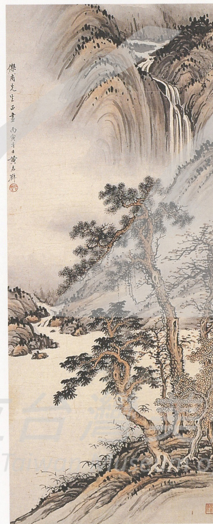
黃君璧 谿山秋色 1926 水墨設色 91×36公分