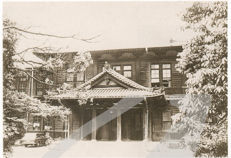
1 東京美術學校正門 2 藤島武二 3 岡田三郎助

●這番話給顏水龍極大的影響，所以，他每次畫畫時，都很小心的畫著每一筆，每一線，每一點，每一個顏色，他說：「不該存在的就不會讓他存在。」如何除去瑣碎，找到對象物的特點，加以不偏不倚的表現，是他一生的追求。