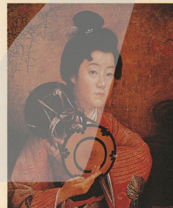
岡田三郎助／婦人像 1907