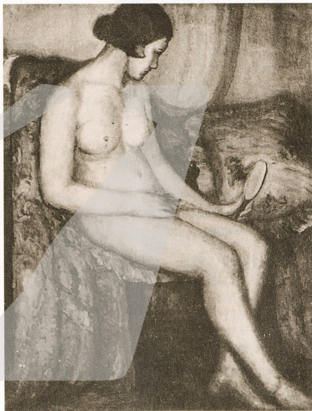
1 裸女 1927 油畫 116.5×91公分 第一屆台展入選

●在回日本之前，一向關懷台灣畫壇的他，仍不斷和藝術界人士接觸，共同為促進台灣藝術的發展努力。同年七月，顏水龍和陳澄波等十三人組織了「赤島社」，並舉行畫展，後來且以油畫「裸女」入選第一屆台展，此時顏水龍在美術界已小有名氣，但他並不以此自傲，他說，他不願以參加畫展或比賽來博取盛名，只是