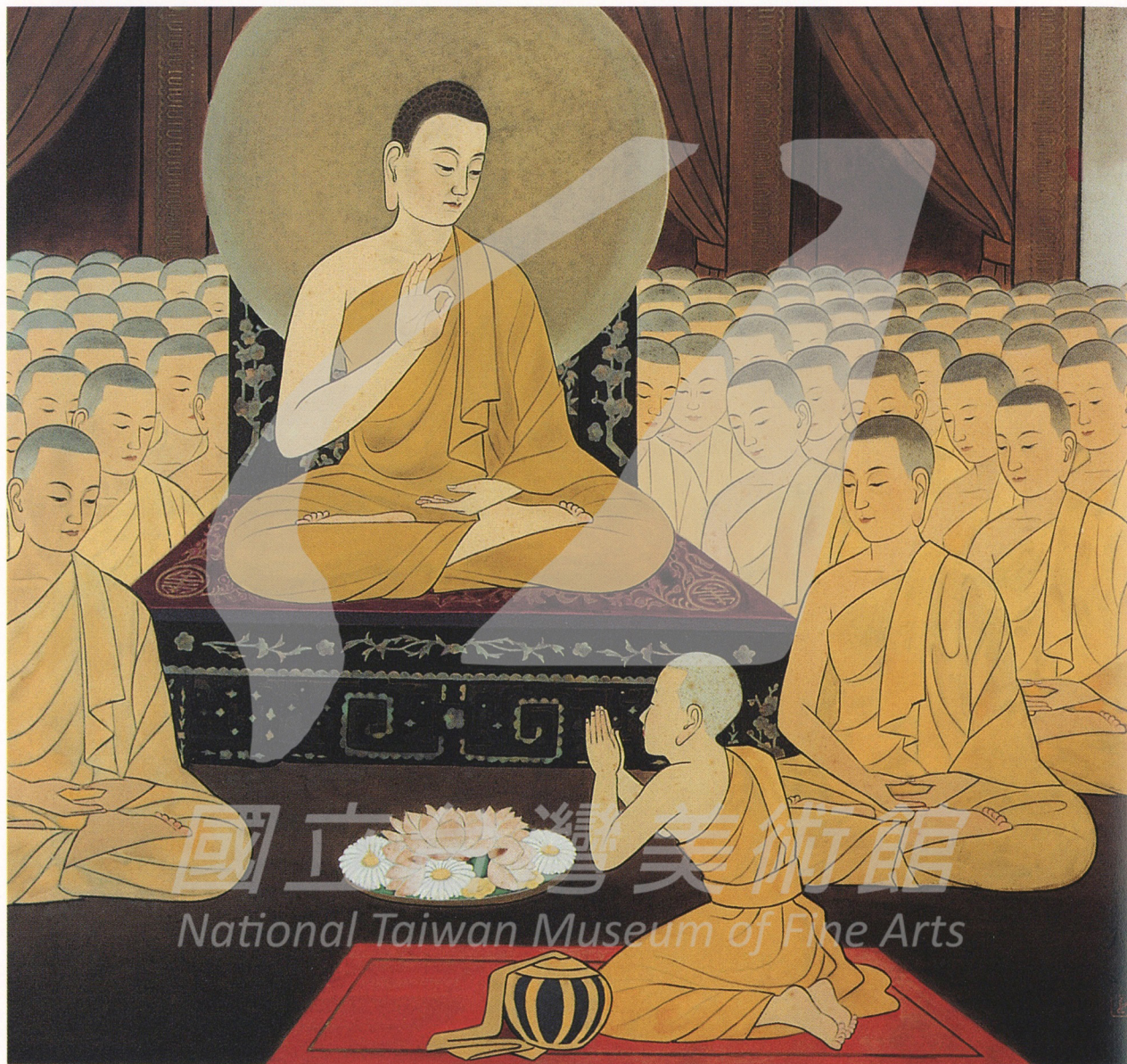
釋迦行誼圖之八 佛陀授沙彌十戒 1965—1967 絹·膠彩 87×97公分