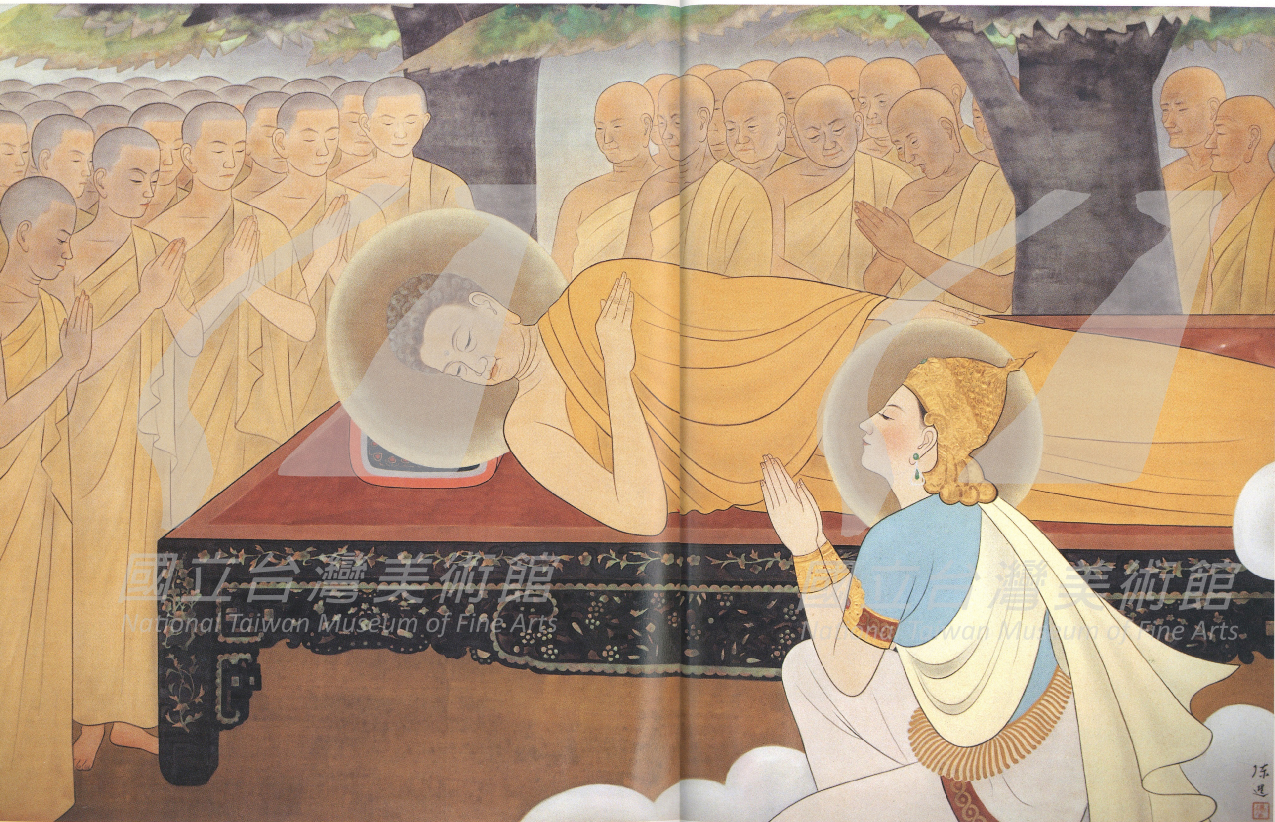
釋迦行誼圖之十 佛陀入大涅槃 1965-1967 絹·膠彩 115×188公分