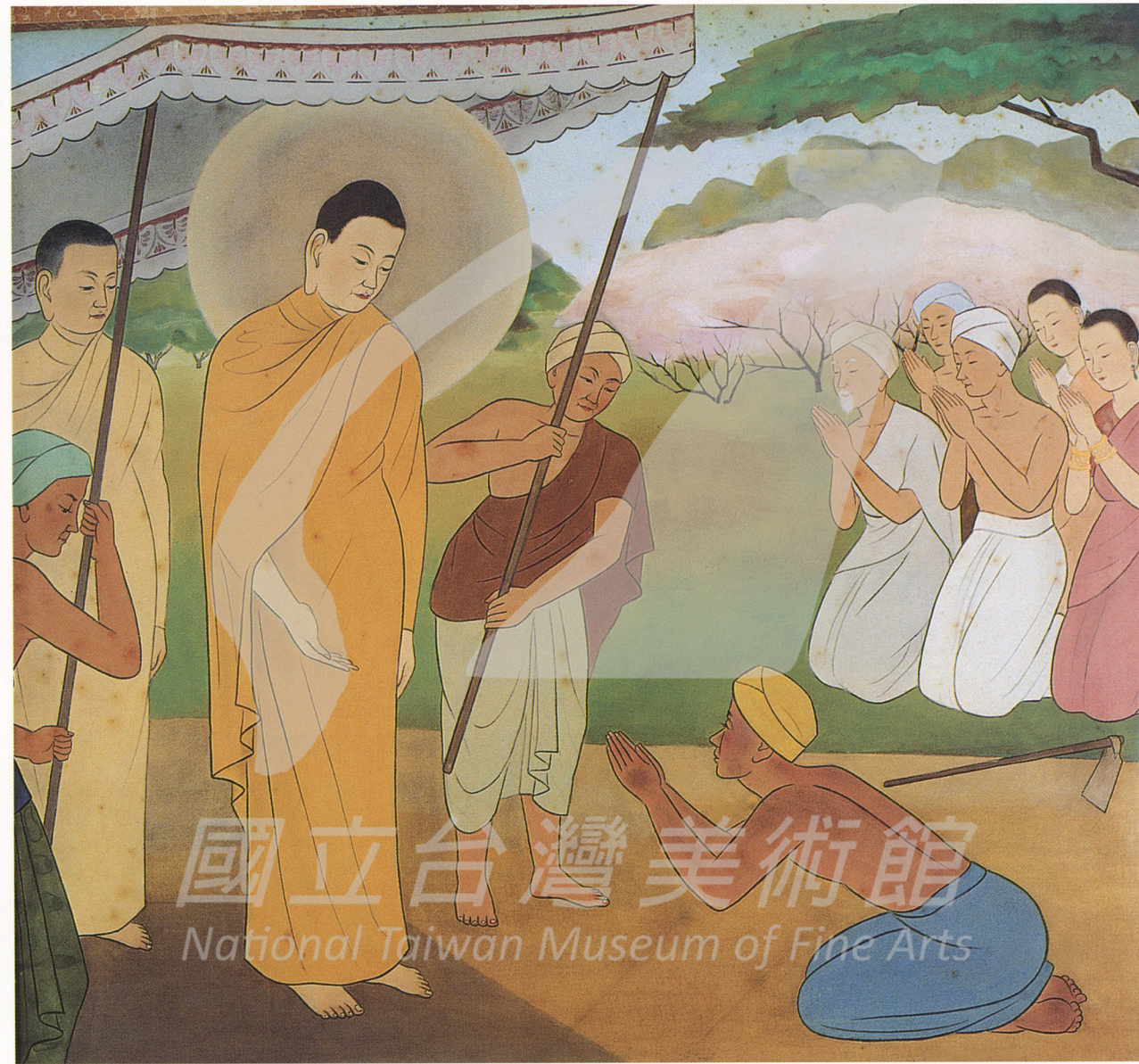
釋迦行誼圖之九 佛陀教化農夫 1965—1967 絹·膠彩 87×97公分