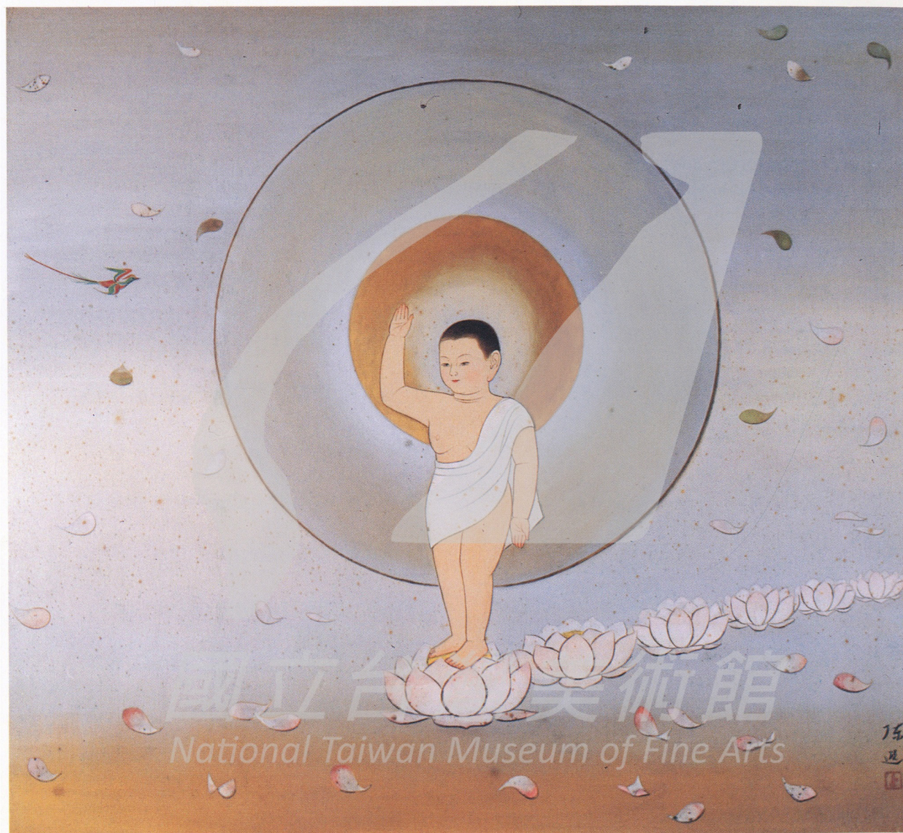
釋迦行誼圖之二 周行七步 1965—1967 絹·膠彩 87×97公分

●悉達多王子二十九歲那年，對人世間生老病死苦痛的悲憫，產生了救度之心，決定放棄驕逸的貴族生活，尋找得道仙