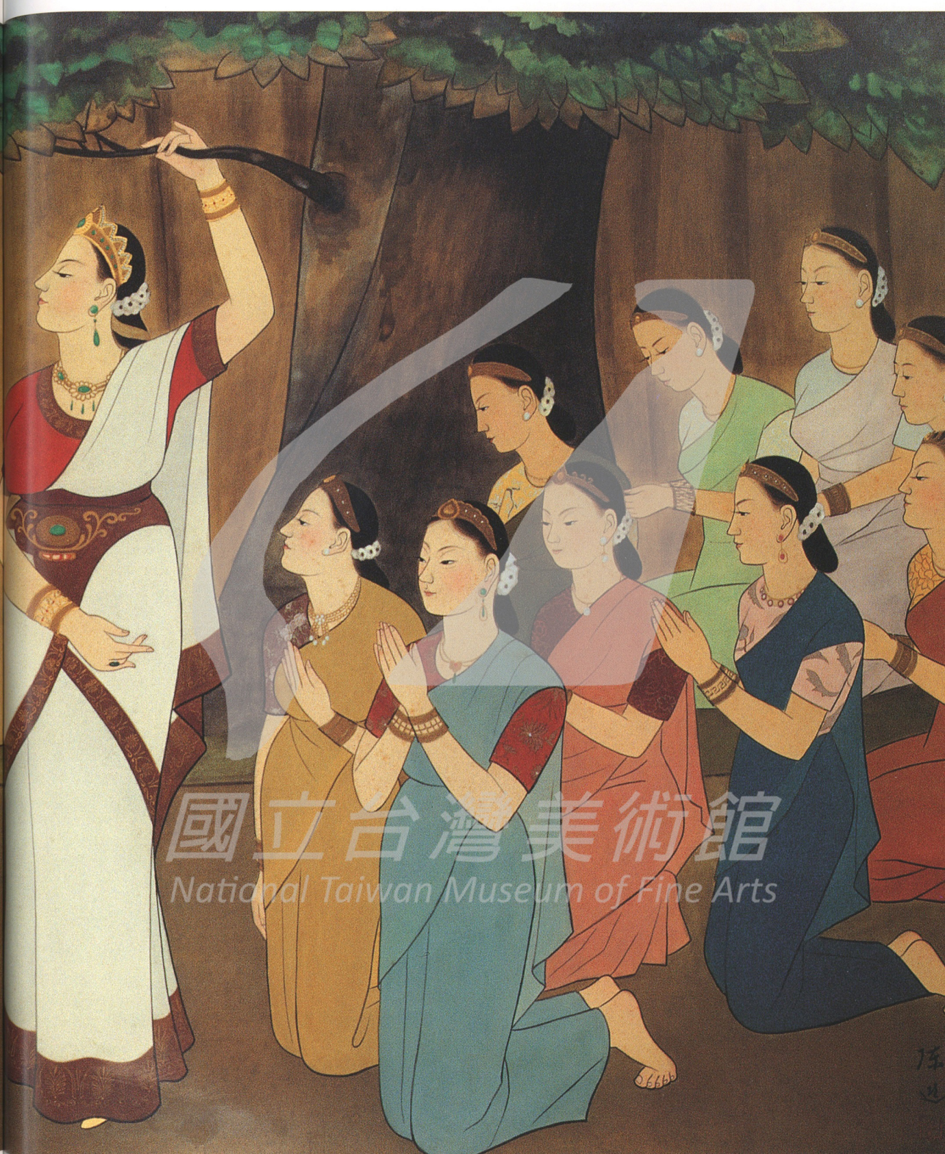
釋迦行誼圖之一 釋迦誕生時 1965—1967 絹·膠彩 115×188公分

國立台灣美術館 National Taiwan Museum of Fine Arts